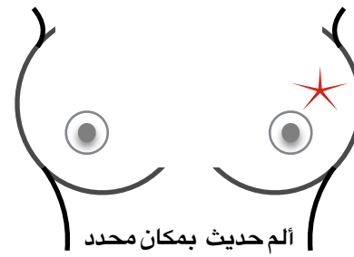
ألم حديث بمكان محدد بالثدى ولا يزول