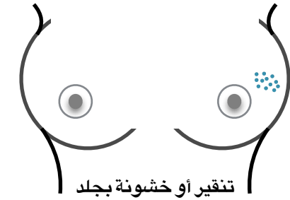
تنقيير أو خشونة بجلد الثدى مثل سطح البرتقالة