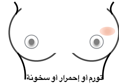
تورم أو إحممرار أو سخونة أو لون داكن بالثدى

يجب إستشارة الطبيب عند ظهور أي من هذه الأعراض