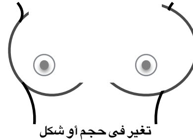
تغير فى حجم أو شكل الثدى أو الحلمة