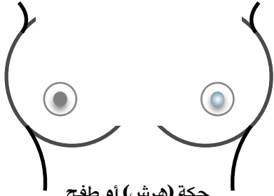
حكة (هرش) أو طفح جلدى أو تقشير بالحلمة