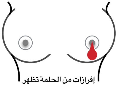
إفرازات من الحلمة تظهر فجأة